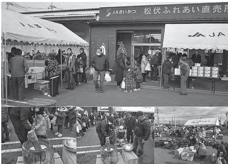
『直売所感謝祭・もち祭』は大変な賑わいでした

松伏ふれあい直売所は町民の皆様に支えられ、2020年6月でオープンからまる5年を迎えようとしております。米所である松伏のコシヒカリや彩のきずな等のお米をはじめ、春夏はトマト・レタス・キュウリ・とうもろこし、秋冬はネギ・大根・ブロッコリー・白菜等々の様々な野菜が店内に並びます。直売所ならではの新鮮な野菜を求めて、月平均約2,300名程(平成31年度4月～12月)のお客様に利用していただいております。