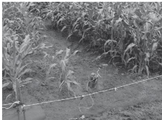
楽落くんライト設置ほ場

「楽落くん」の原理をそのままに、より簡単に低コストで設置できるようにしたものが「楽落くんライト」です。