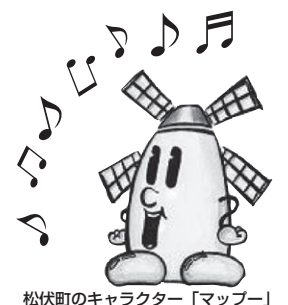
松伏町のキャラクター「マッパー」