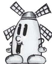
松伏町のキャラクター「マップー」

※東北地方太平洋沖地震に伴う計画停電等の影響により、窓口業務の停止や催し等が中止される場合があります。事前の確認をお願いします。