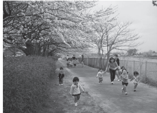
桜のトンネル(4月の様子)

大落古利根川沿い(田中地区)の松伏交番付近から越谷市境付近(寿橋手前)までの1.5kmの遊歩道が埼玉県の施工で完成しました。春の心地よい風を感じながら水辺を散策してみたいはいかがでしょうか。