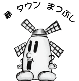
松伏町のキャラクター「マップー」