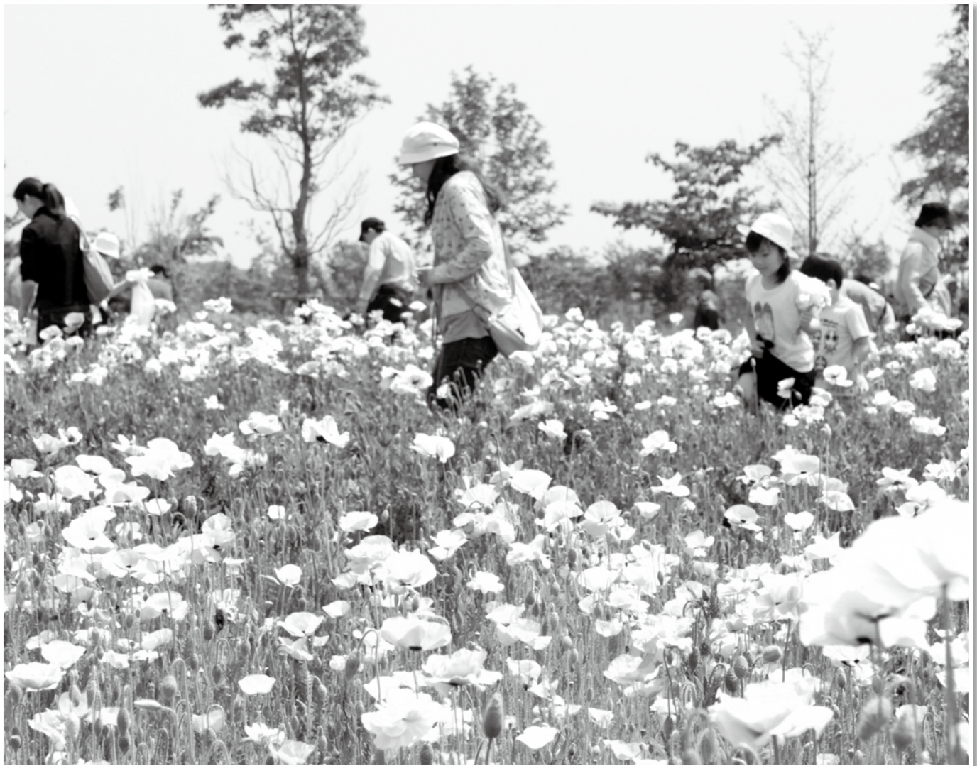
ポピーまつりが行われました【5月21日】 ▶詳細は8ページ