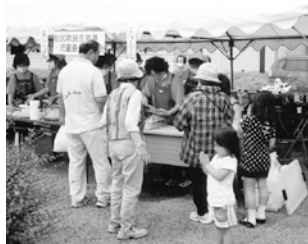
福祉のふれあい広場