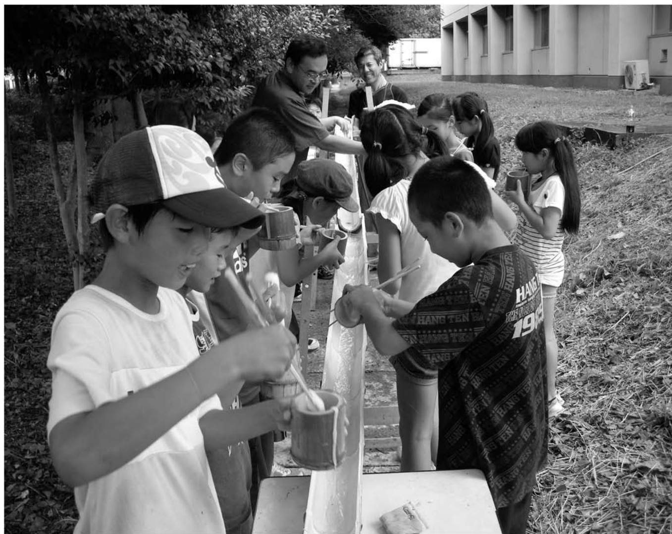
流しそうめん、楽しいな! (「遊び探検隊」より) 【8月5日】 ▶ 詳細は7ページ