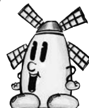
松伏町のキャラクター「マップー」