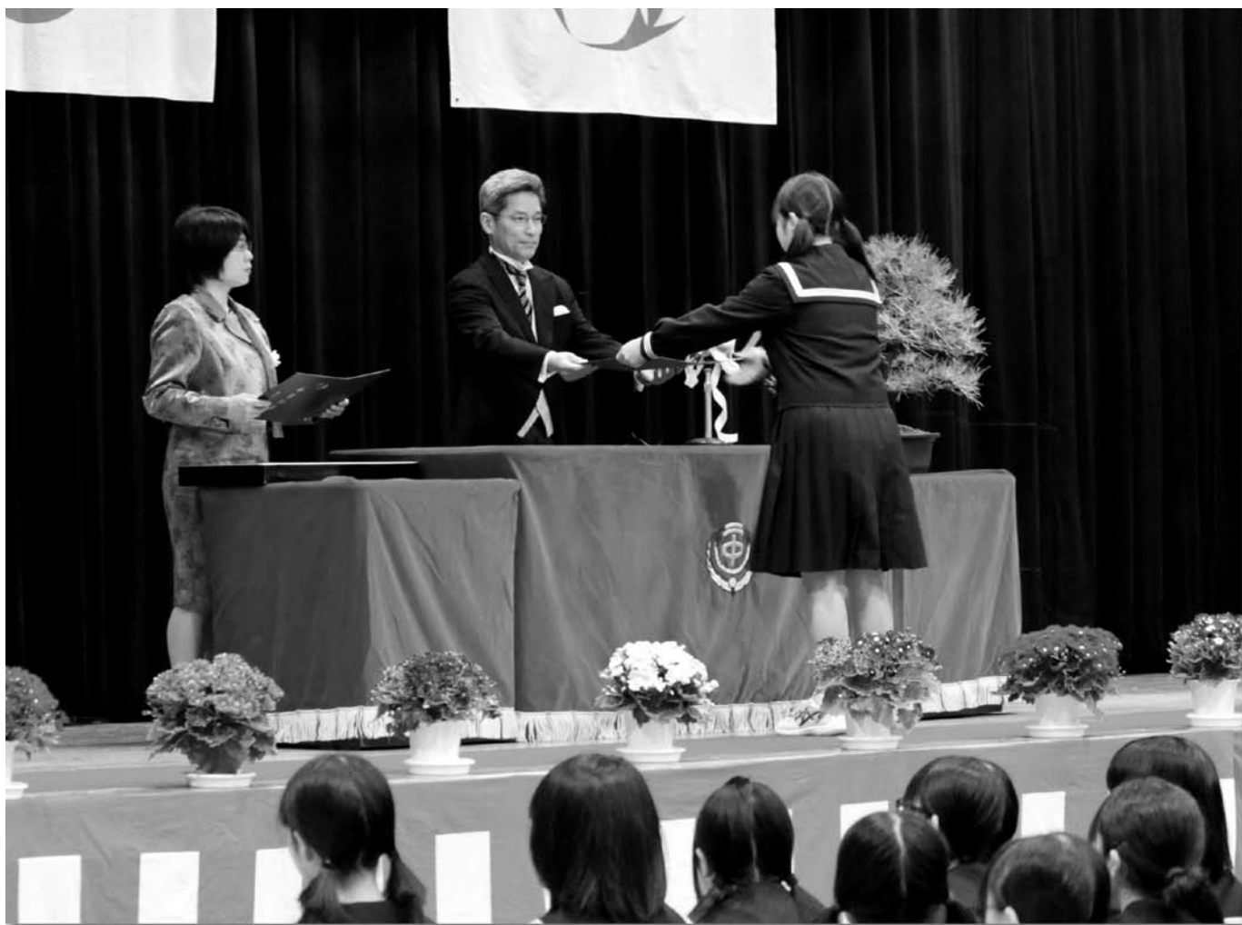
町内中学校で卒業証書授与式が行われました【3月15日】 ▶詳細は10ページ