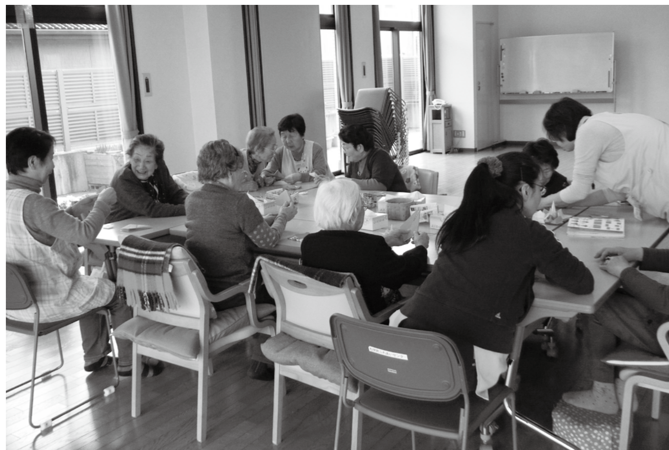
私たちは、介護認定を受けずに元気で暮らしています（ふれあいデイサービス）