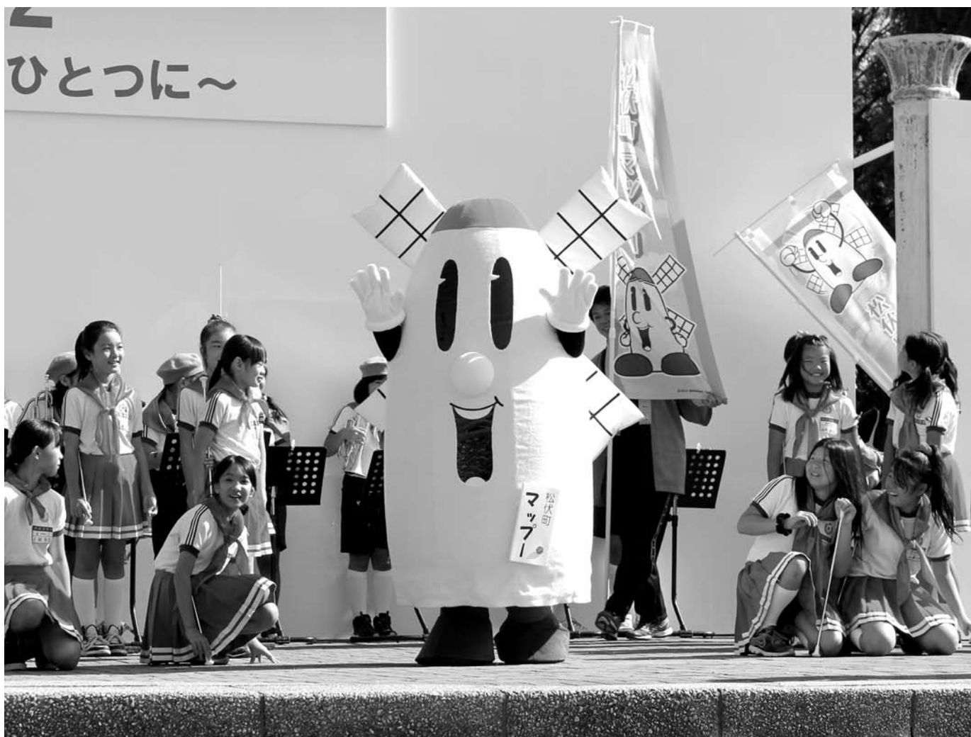
まつぶし町民まつり2012で、町のイメージキャラクター「マッパー」が着ぐるみになって初お披露目! 【10月21日】▶詳細は10ページ