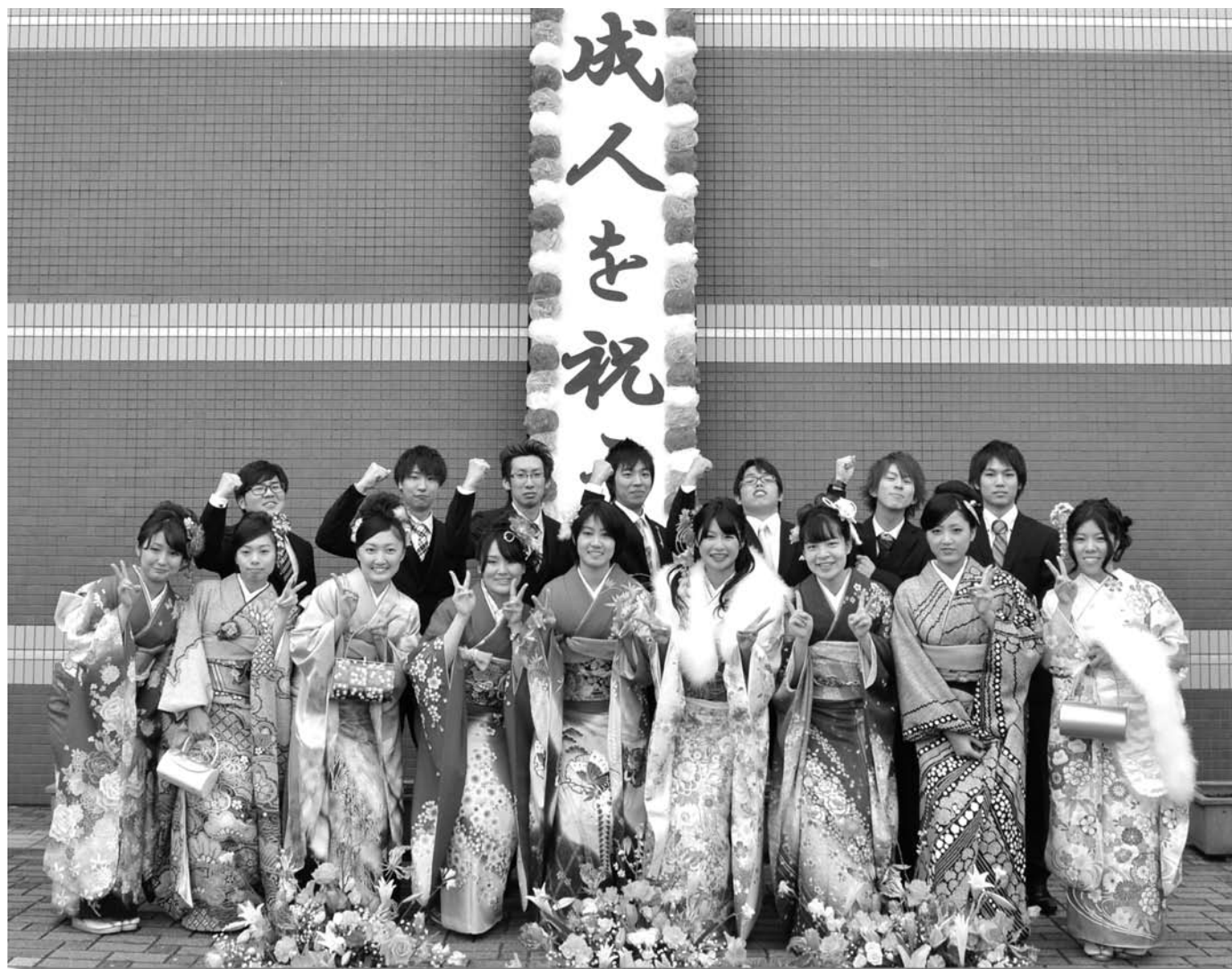
「平成25年成人を祝う会」が開催されました。写真は、実行委員の皆さんです。【1月13日】