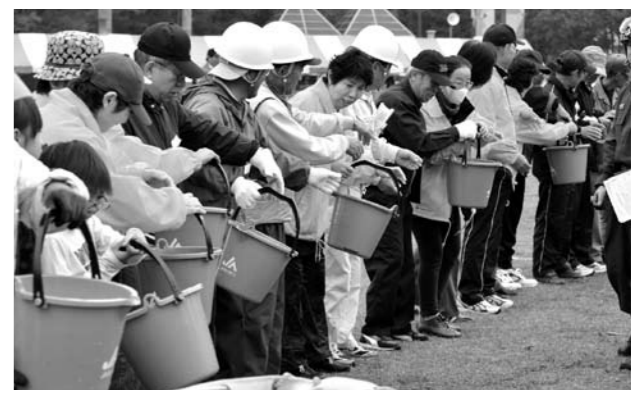
【自主防災組織等 町民の皆さんが参加した防災訓練】

ひとたび災害が発生した場合、様々な理由により、町や消防署など防災関係機関の活動が制限され、迅速な対応ができないことが想定されます。そのようなことを考え、常日頃から災害に対し地域住民が力をあわせ、初期消火や隣人の安否確認、応急処置などを行えるようにしておくことが重要です。町では、皆さんの地域の自主防災組織設立を応援します。