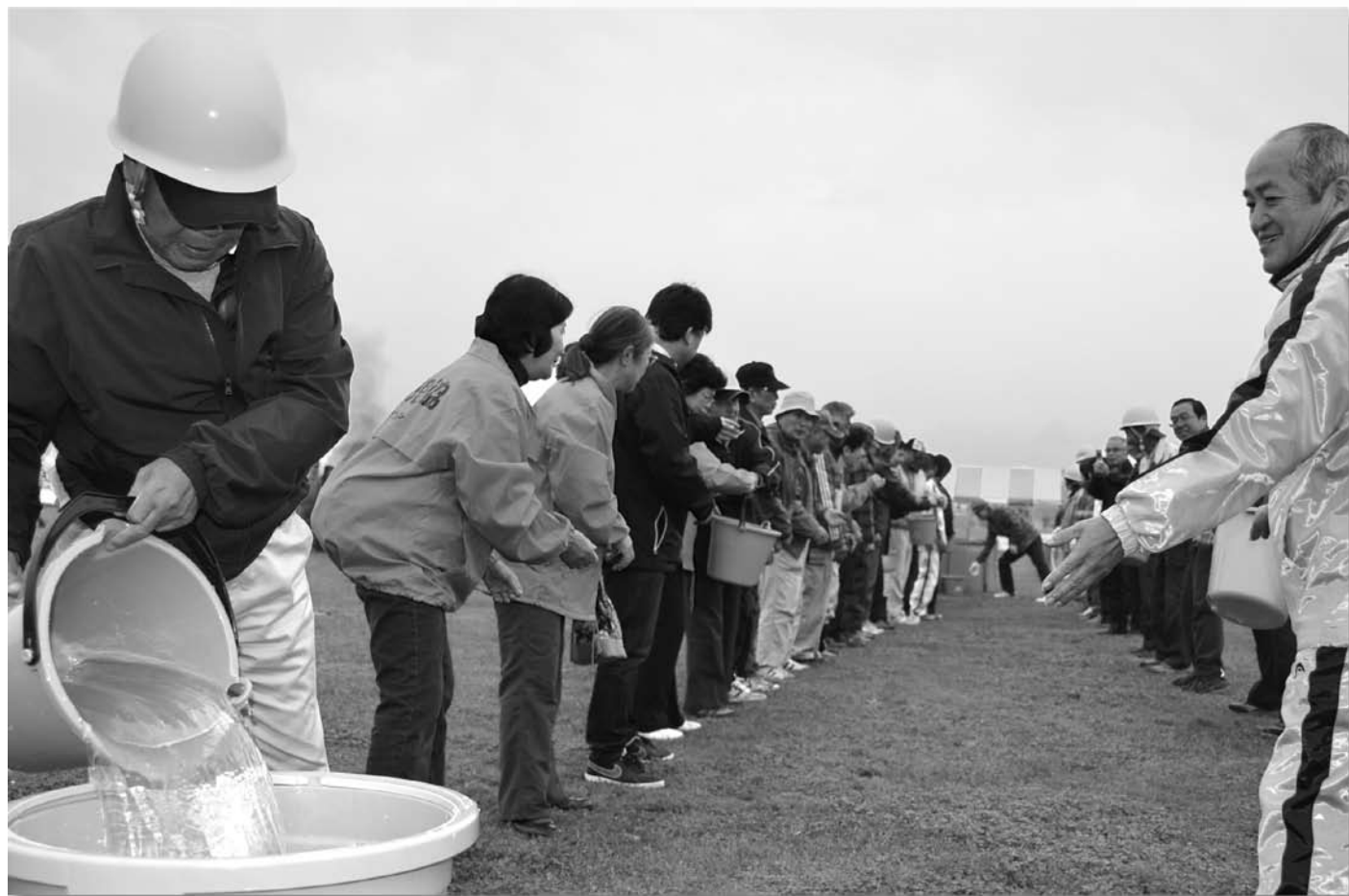
防災訓練を実施しました。多くの住民の方が参加されました。(まつぶし緑の丘公園)