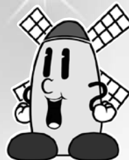
松伏町のキャラクター マップー