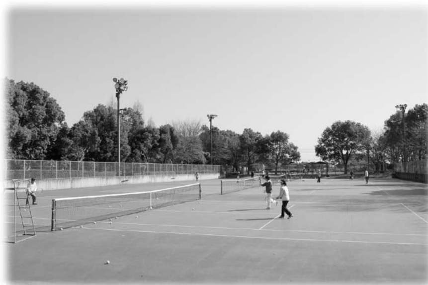
スポーツをする様子