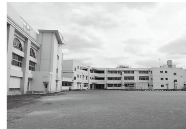
改修予定の松伏第二小学校

答 第二小学校は、昭和54年に建設された。屋上の防水改修で雨漏りの防止、外壁の補修・塗装・アルミサッシの入れ替えを考えている。また床仕上げ材等の改修を含めトイレの改修をする。更にLED照明を導入する。