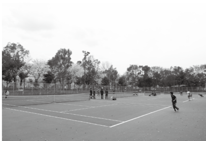
改修された松伏記念公園テニスコート

答 今回は20年以上メンテナンスをしていなかったため、利用者からも要望があって改修した。料金収入だけでは賅えないが、良好な環境を保つための値上げだ。