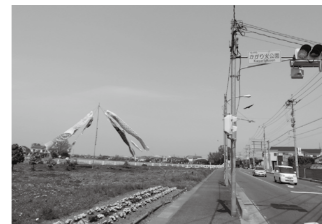
古利根川沿いの「かがり火公園」予定地

答 面積は、約1000㎡である。国の補助金活用や起借り入れが可能となった。さらに県の用地約1000㎡が無料使用できるようになったので、大変有効である。その結果、総面積は約2000㎡になった。