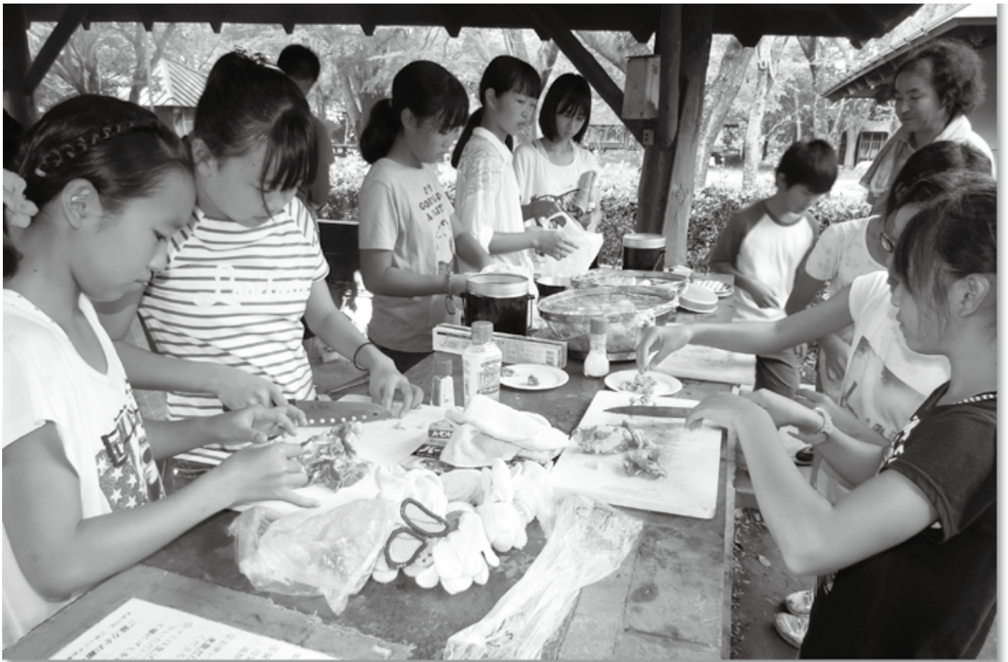
サマーキャンプで楽しい夏の思い出ができました！（茨城県の「水海道あすなろの里」）