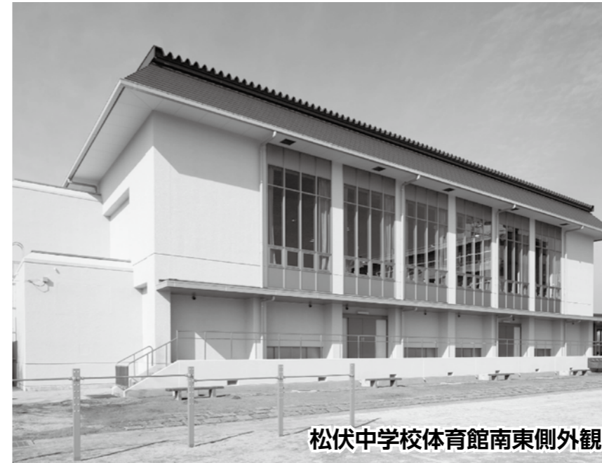
松伏中学校体育館南東側外観