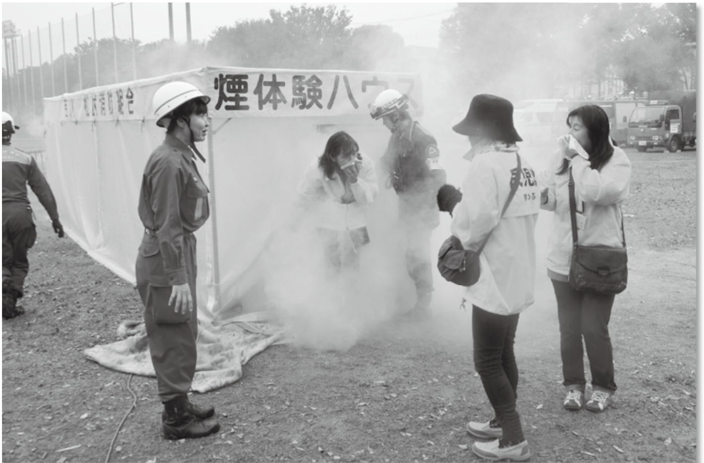
防災訓練を実施し、煙が充満し視界が全くない中を避難する煙中体験訓練等を実施しました(松伏記念公園) ▶詳細は10ページ