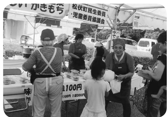
「民生委員・児童委員はいつもそばにいます」

売上金の一部は、社会福祉協議会に寄付し、残りは民生・児童委員協議会の活動に役立てて行きたいと思っております。