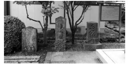
▲「東陽寺庚申塔群」 (町指定有形民俗文化財)