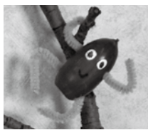
▲アヒルのガービー ▲どんぐりぼうや