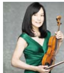
千住真理子