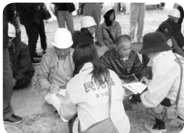
昨年の防災訓練での安否確認の様子

近ごろ、台風、豪雨、竜巻、地震などの災害が多く、その発生被害も大きくなっています。