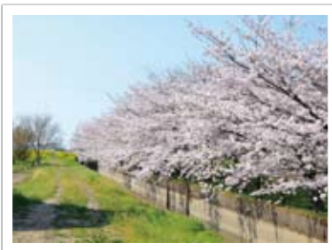
▲二郷半領用水路沿い(赤岩橋付近)からし菜も一緒に楽しめます