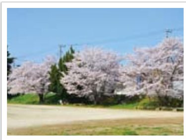
▲今月オープンする松伏町北部サービスセンター(旧老人福祉センター)