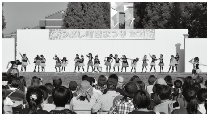
ステージでのダンス