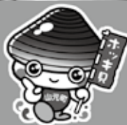
山元町PR 担当係長 ホッキーくん ©2016山元町ホッキーくん#40