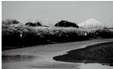
運が良い時は、遊歩道の近くから富士山が見えることも!?