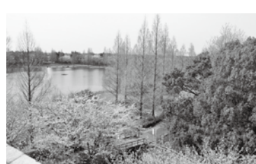
風車には展望台があり、高いところから桜を見わたすことができます!(夜間と年末年始は上れません)