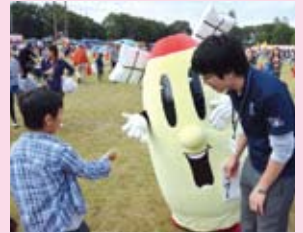
▲まつぶし町民まつり 2016にも参加したよ！