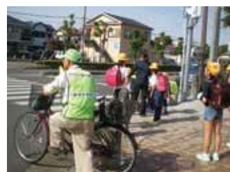
①ボランティアによる見守り