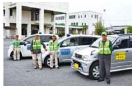
地域の安全安心を守る 「青色防犯パトロール隊」

車両9台に青色回転灯を付け、小・中学生の下校時間を中心にパトロールを行い、地域の防犯と共に子どもたちの安全を見守っています。