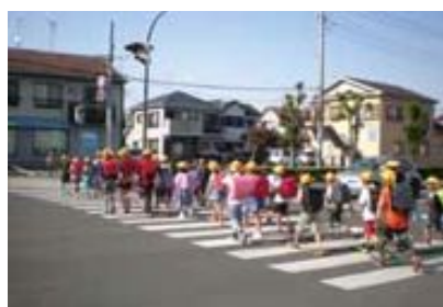
④一斉下校、集団下校指導