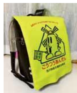
③ランドセルカバー

吉川地区交通安全協会からご提供いただき、小学1年生に配布しています。遠くからも目立つように蛍光の黄色のカバーにマップーが描かれています。