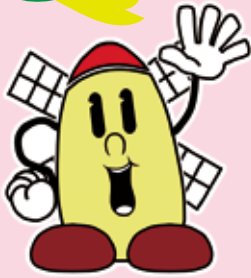
松伏町 PRキャラクター マップー