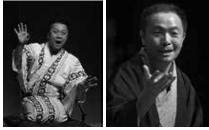
道落亭かね平氏 久伊豆亭駄咲氏 固いきいき福祉課 ☎991-1882

<県内の催し> || 「笑ってすごす人生100年時代」 ~住み慣れた家で私らし く暮らしたい~ || 日2月11日(火・祝)10:00~11:30 場吉川市民交流センターおあしす 内在宅医療や介護について知って いますか。落語を通して楽しみなが ら考えるきっかけにしてみませんか。 定250名 費無料 申不要 【主催】 吉川・松伏多職種連携の会 【講師】 越谷サンシティ落語研究会