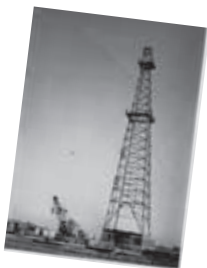
石油・天然ガス探査作業風景 (昭和38年内前野地区)