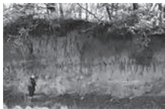
金杉台地の関東ローム層露出部分

発売開始日 5月11日(月) 9:00～ 販売場所 教育文化振興課 価格 4,000円