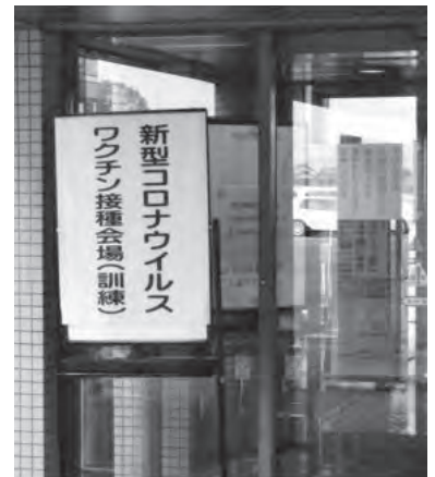
3月28日にワクチン接種訓練が松伏町中央公民館にて行われた

答 町長 令和3年2月4日に新型コロナウイルスワクチン接種推進本部を立ち上げ、接種を迅速・確実に実施すべく体制を整えた。高齢者の接種会場への移動手段確保のため、専用タクシー券を発行する。国からのワクチン供給が遅れており、今後の予定については町からの情報を注視してほしい。