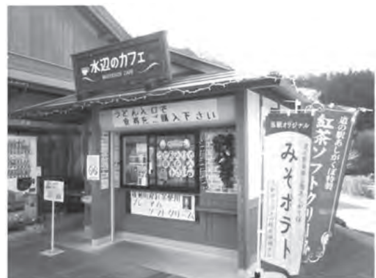
埼玉県横瀬町の道の駅「果樹公園あしがくぼ」

答 町長 東埼玉道路の開通とこの道の駅が松伏町の拠点づくり、第5次総合振興計画の中における核となるところとして、交流人口の増加、高速道路を通して松伏道の駅という看板が見えれば、松伏という地域がここにあるのだなという、町の魅力を示すことができると思っている。