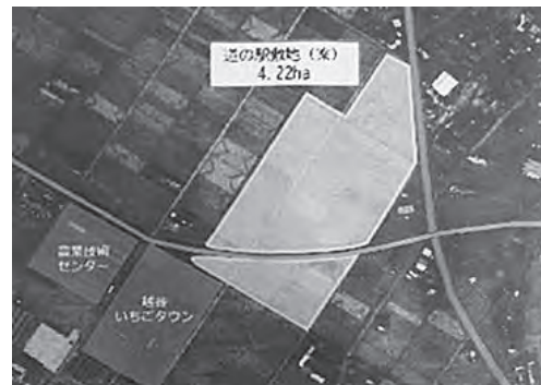
越谷市の道の駅候補地は、町の同施設予定候補地から、わずか3キロ先に決まった。

答 私の周りの農家の人たちは、つくってほしいというふうに聞いている。意見聴取の場所の違いだ。