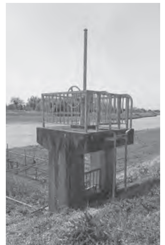
大川戸地区にある寺前揚水機場

ンで区切られた相談コーナーを利用している。令和3年度は、相談室を3部屋設置する計画で、うち1部屋は子ども家庭総合支援拠点相談室として利用し、残りの2部屋はフリーで利用できる相談室となる。これらの相談室を有効に活用し、個人情報に配慮していく。