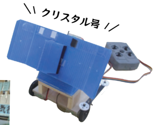
使用したロボット紹介