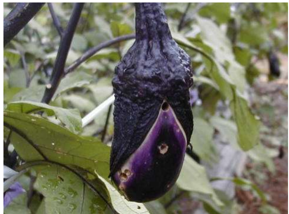
写真2 オオタバコガ幼虫による果実の侵入痕