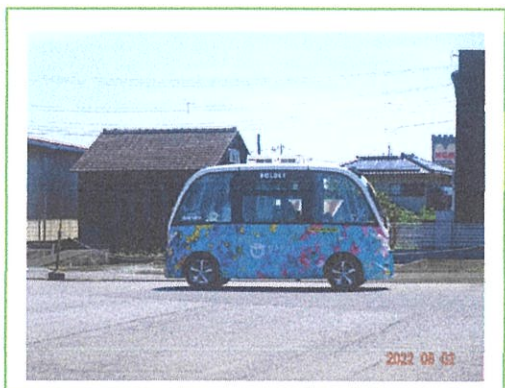
「さかいアルマ」バス