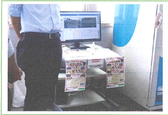
駅舎内での説明に使われた PC