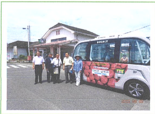
体験乗車したバス