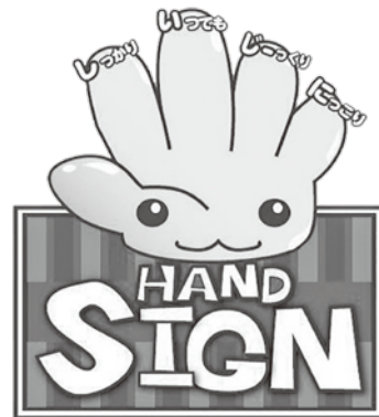
道路横断時の安全行動イメージキャラクター 「サイン(SIGN)ちゃん」