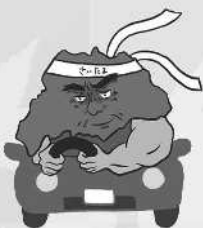
歩行者優先 イメージキャラクター 「さいたまお父さん」

※統一行動日とは、関係機関・関係団体が連携を図り、一斉に交通事故防止の啓発に努める日のことです。