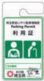
その他障害者、 要介護者等用