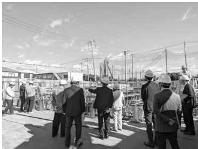
新保健センター建設現場

1月には建物床下部分の地中梁の配筋工事が施工され、さらに建物の建設が行われます。令和8年12月竣工、令和9年4月開所というスケジュールです。