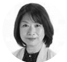
ひらの ちほ 平野 千穂 (日本共産党)