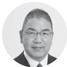
かわかみ つとむ 川上 力 (公明党)