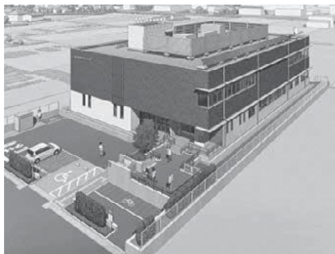
※上のイラストは指令センターの完成イメージ図です。 所在地は越谷市大字大泊 309 番地 1 となります。