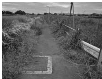
通学路に繁茂する雑草

答 町長 農地の集約化は、農作業の効率性や生産性の向上と、耕作面積の拡大により安定した農業経営が可能になる。町では地域計画で定めた地域の担い手への農地の集積・集約の目標に向けて、引き続き農家への支援を行っていく。