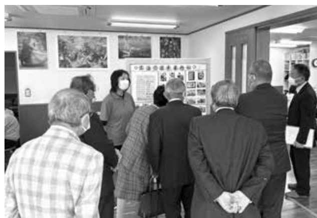
生活介護施設「心」で説明を聞く

松伏町立かるがもセンターは社会福祉協議会が運営している。生活介護事業の7名と就労継続支援B型事業所6名であり、作業内容は箱の組立や石鹸作りやビーズの作成など工賃は7,000円から10,000円位である。職員は所長を含め12名である。