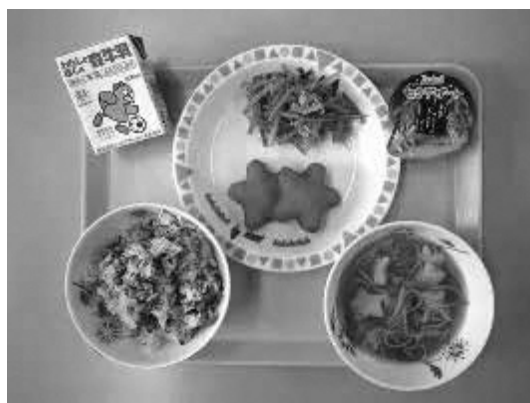
給食無償化に期待

答 町長 地域の皆様にとって利用しやすい公共交通政策を進めるために、令和7年3月に策定した松伏町地域公共交通計画に基づき、町内を移動できる公共交通政策について調査・研究していく。