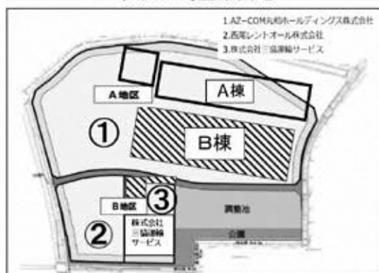
松伏田島産業団地

答 町長 行政からの一方的な情報伝達ではなく、参加者と私が双方向で意見交換できる機会であり、誰もが気軽に意見を表明でき、町を今まで以上に身近に感じていただけるように、始めたもの。